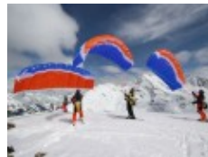
Speedflying in Les Arcs, Frankreich