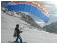
Speedflying am Mölltaler Gletscher